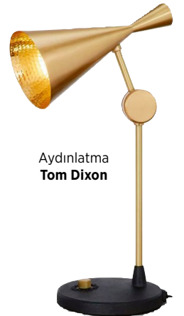
Aydınlatma Tom Dixon