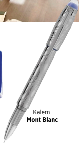
Kalem Mont Blanc