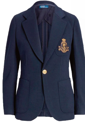
Ceket Ralph Lauren

“Kendi içimizde büyümemiz ve bilgilenmek için öğrenmeye açık olmamız lazım.”